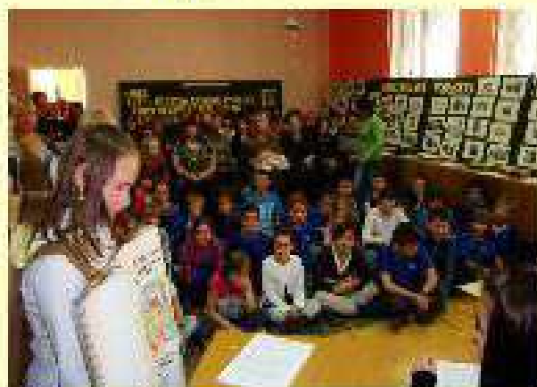
Zajęcia otwarte – Sąd nad książką