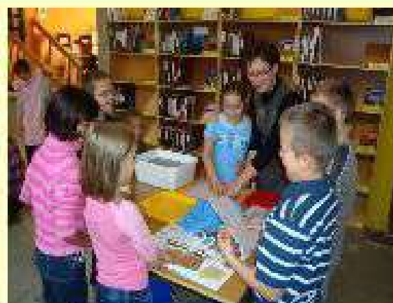
Papier ręcznie czerpany