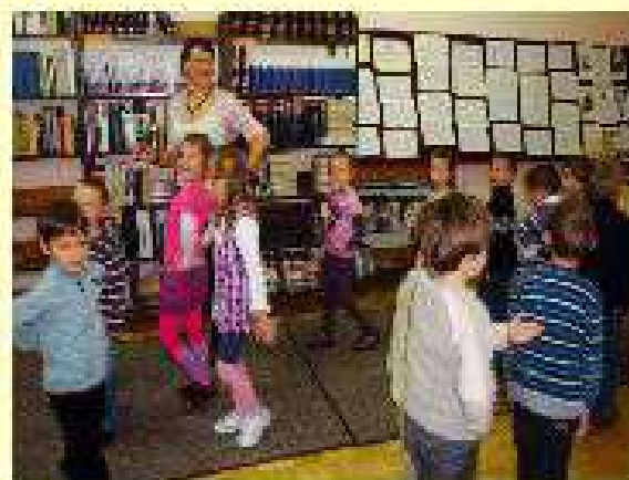
Z zawodami za pan brat