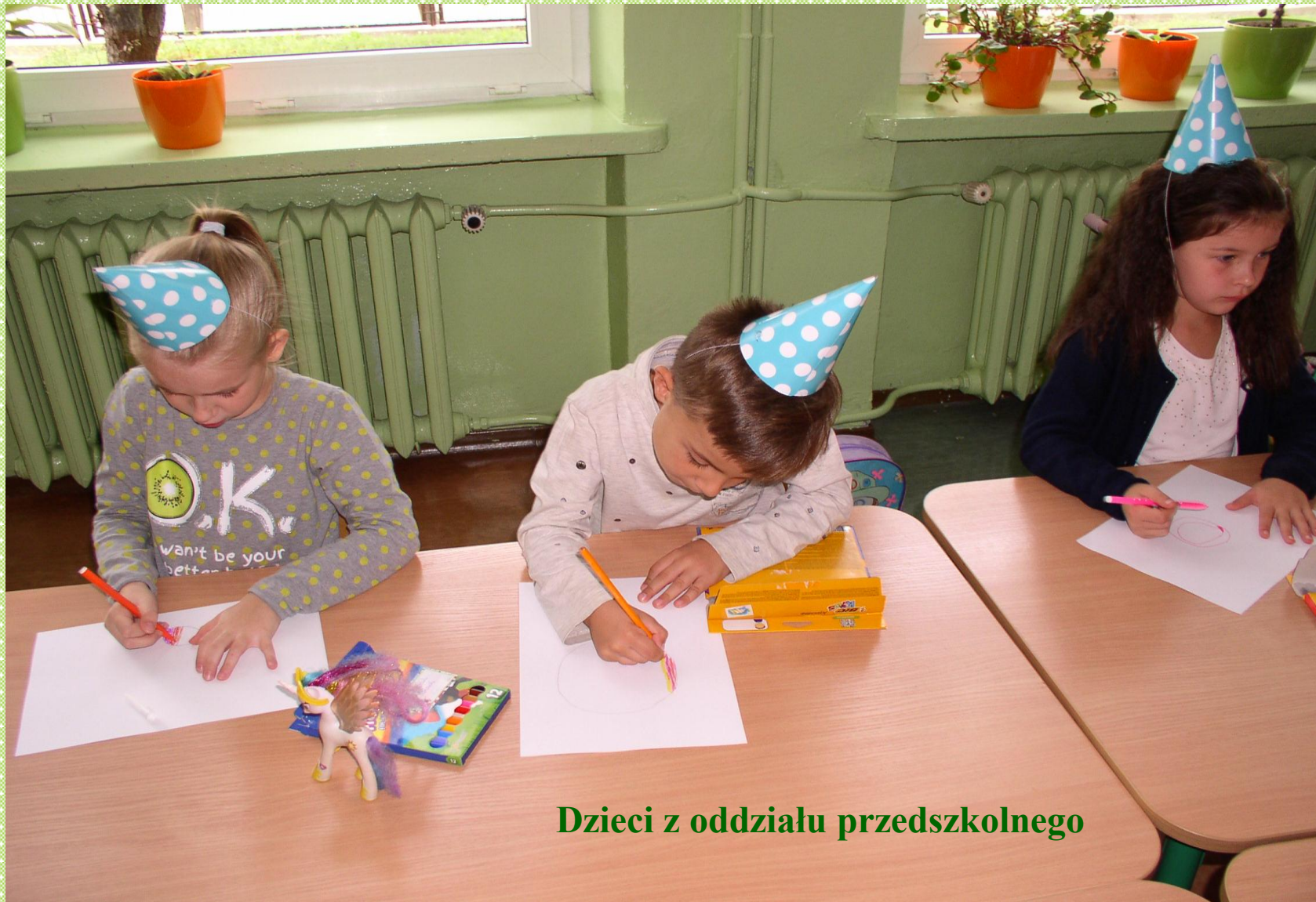
Dzieci z oddziału przedszkolnego