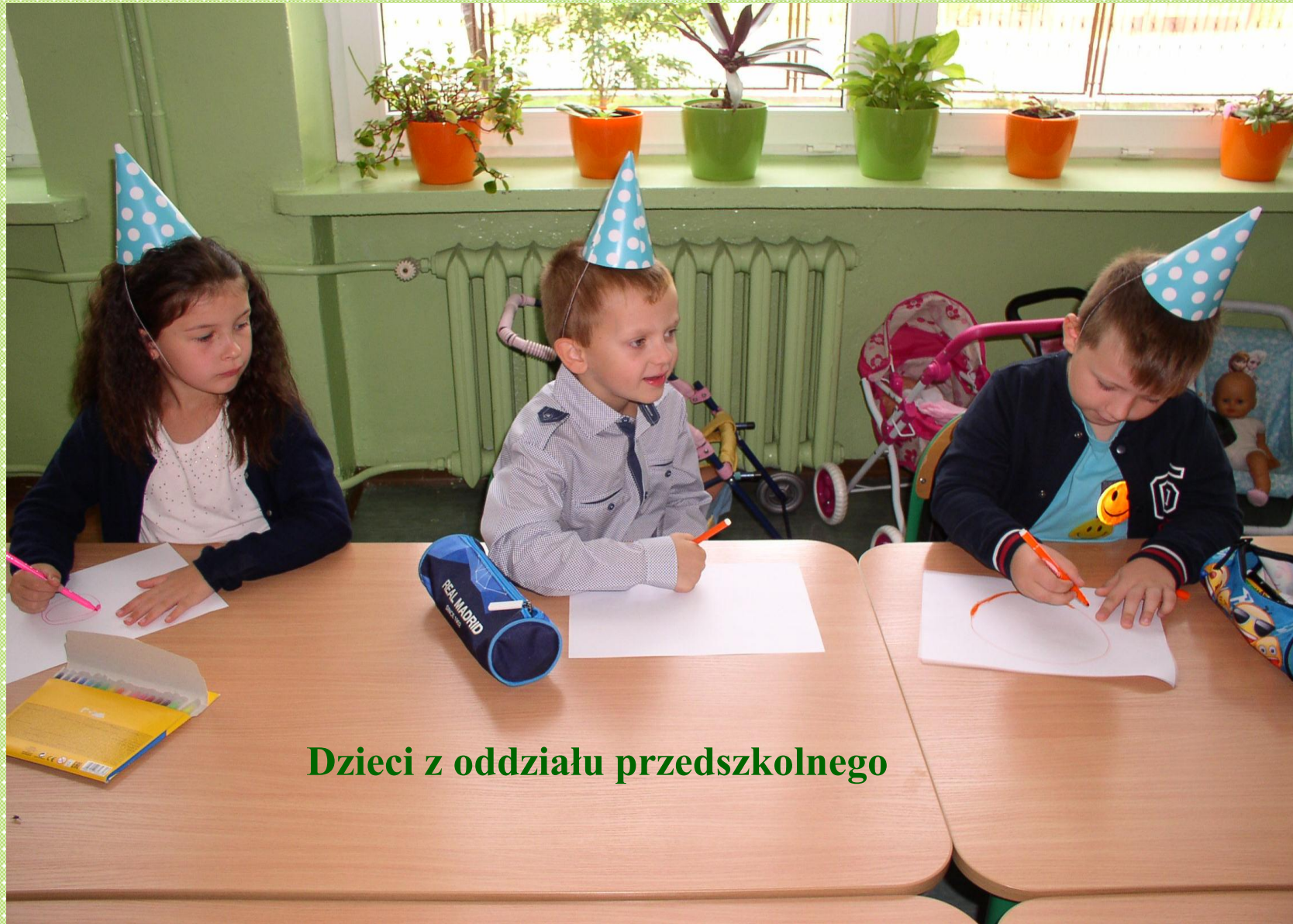
Dzieci z oddziału przedszkolnego