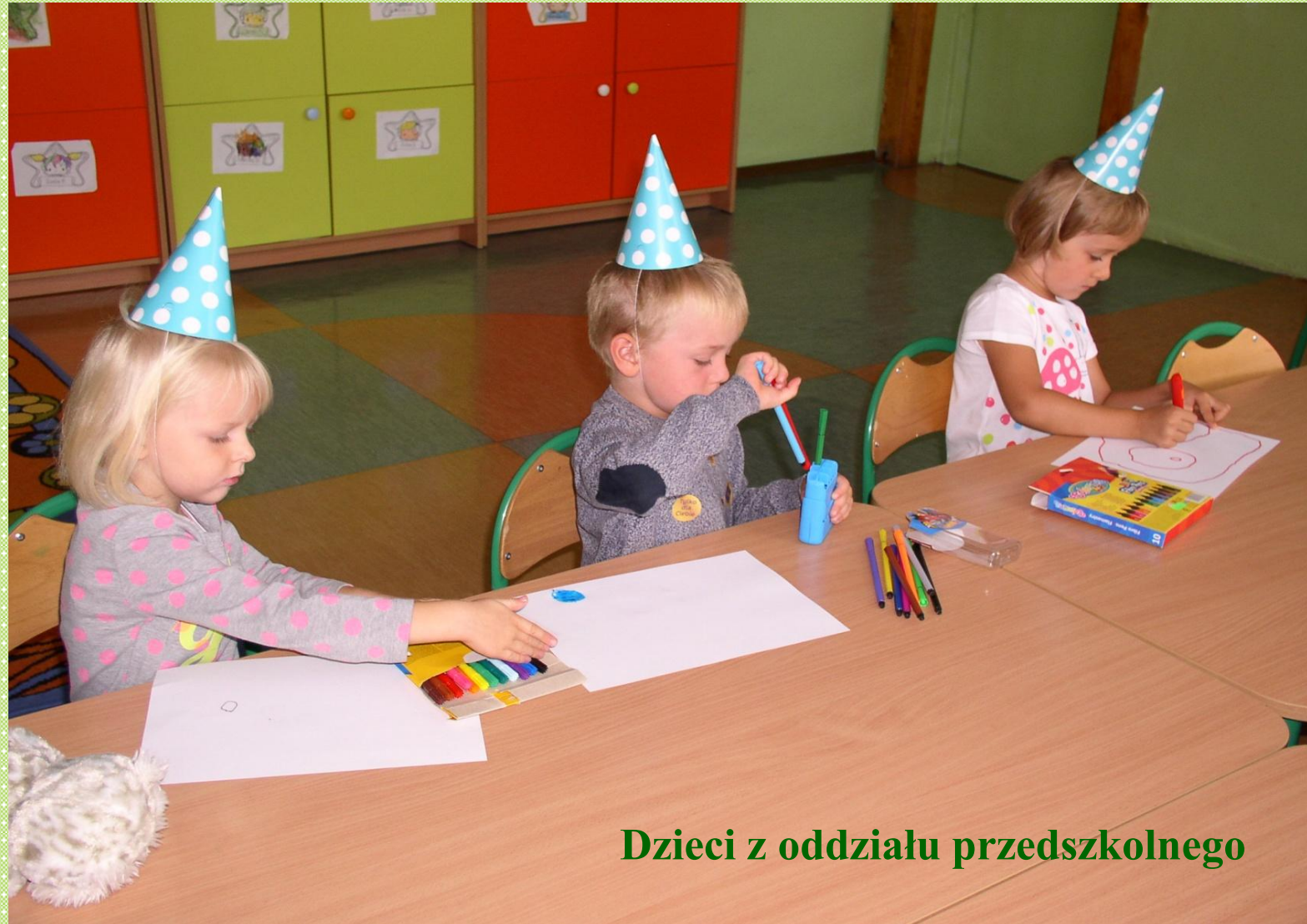
Dzieci z oddziału przedszkolnego